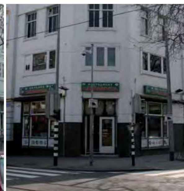
Na toepassing van de nieuwe reclameregels